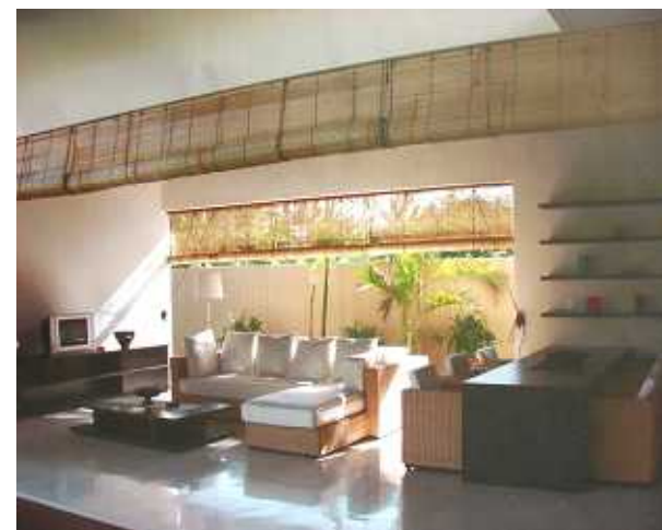
リビングのリフォ-ム

上の写真は、アタで作ったかごです。バリ在住のスタッフが買い付けます。 下の写真は、ストーンカ-ビン(石の彫刻)です。好きな形・サイズに削れますよ。